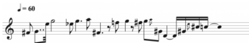
Figure 5. Transcription Section VIII, soprano (transcription approximative). Passage intégré dans les séquences IR, IRR1, IRR3 et IRR4.

Ce passage a justifié le développement de la nouvelle version. La nécessité de re-coder ce passage a convaincu Risset de l'importance du développement de la nouvelle version (De Sousa Dias, 2018). A ce moment-là, l'électronique dialogue avec la soprano. Pour la version de 1977, Risset a utilisé