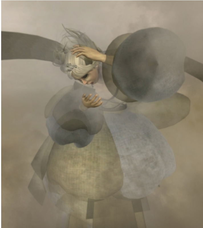
You see my inside , © Catarina Carneiro de SOUSA.