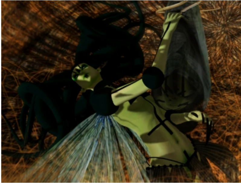
Stage 2 , © Catarina Carneiro de SOUSA.