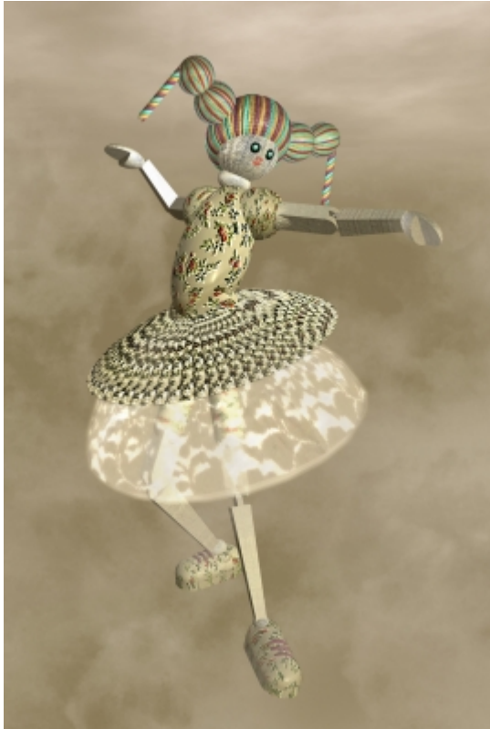
The birth of Gorgonea , © Catarina Carneiro de SOUSA.