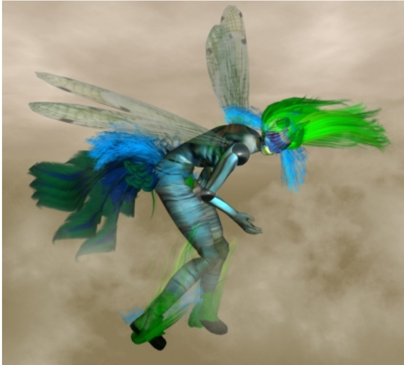
Ragdoll , © Catarina Carneiro de SOUSA.