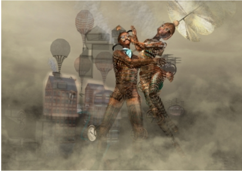
Stage 4 , © Catarina Carneiro de SOUSA.