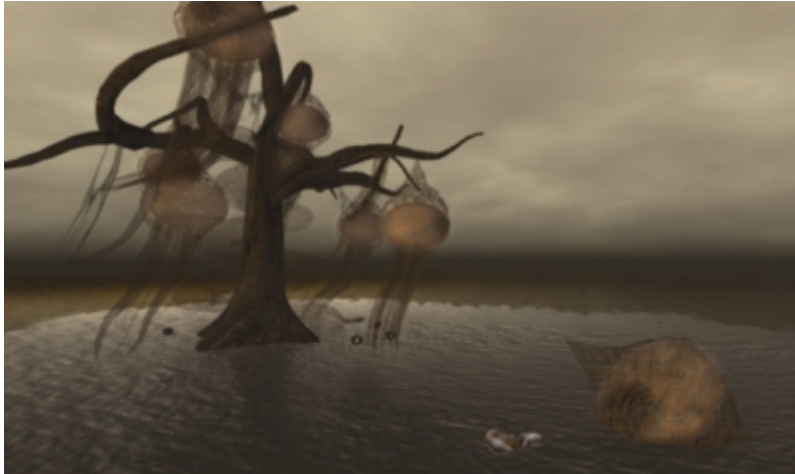
Stage 1 , © Catarina Carneiro de SOUSA.