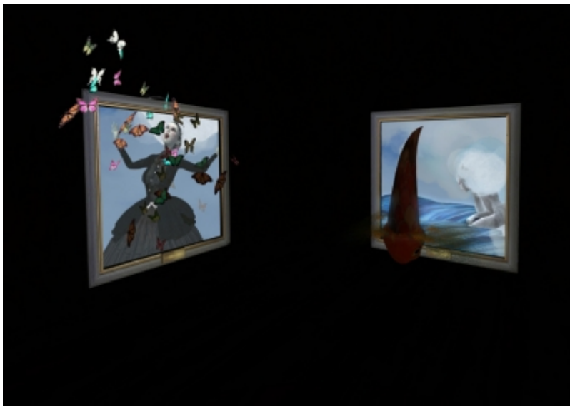
Rusted Love , © Catarina Carneiro de SOUSA.