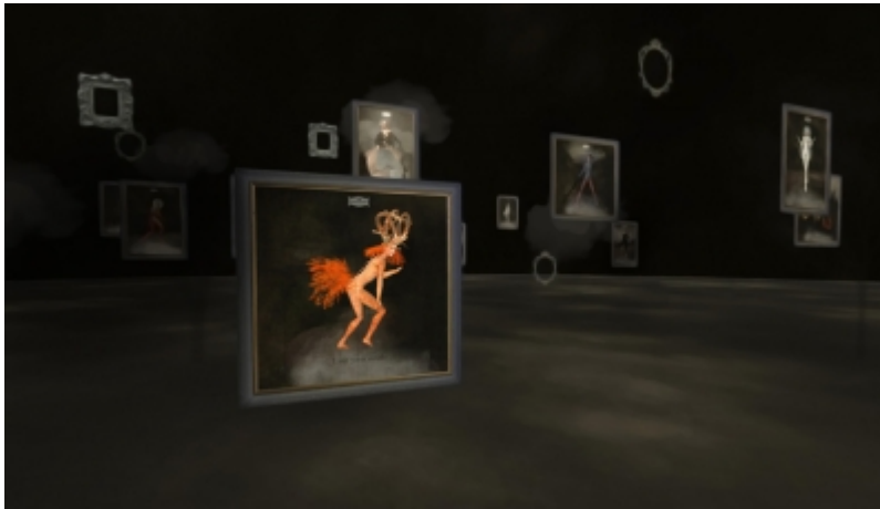
Haunted Fog , © Catarina Carneiro de SOUSA.

Instalação Meta_Body no SL, ©Catarina Carneiro de SOUSA, 2013.