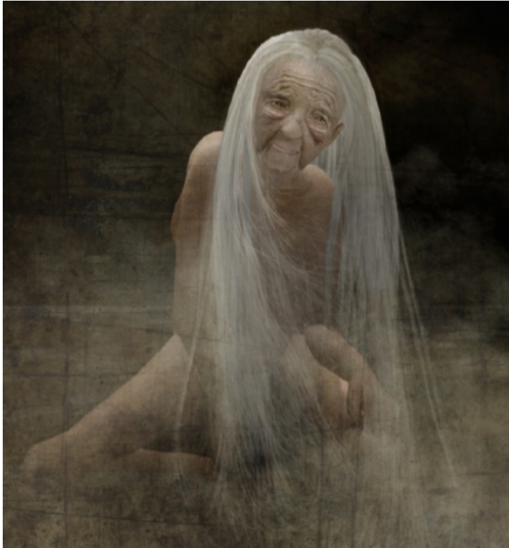
Chart Man , © Catarina Carneiro de SOUSA.